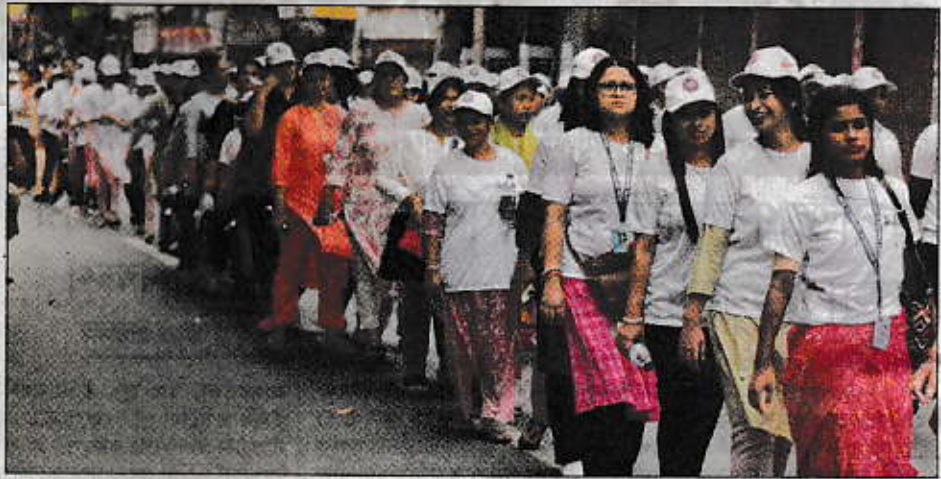
ইকফাই বিশ্ববিদ্যালয়ের আলোকদীপ্ত ২০ বর্ষ পূর্তি উপলক্ষে আগরতলার রাজপথে প্রতিষ্ঠানের ফ্যাকাশ্টি, কর্মী, বর্তমান ও প্রাক্তনীদের মেলবন্ধনে বর্ণময় শোভাযাত্রা। — শনিবারের নিম্নস্থ ছবি।

এছাড়া, বিনামূল্যে আইনি সহায়তা পরিষেবা, নিকটবর্তী গ্রামের ছাত্রদের বিনামূল্যে শিক্ষাদান, রক্তদান শিবির, কোভিড সময়কালে স্থানীয় মানুষের জন্য খাদ্য ও বস্ত্র বিতরণ, বৃক্ষরোপণ, বৃদ্ধাশ্রম ও অনাথ আশ্রমের প্রতি দাতব্য সেবা, যোগ শিবির পরিচালনা